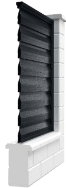
Secțiune panou gard cu bolțari