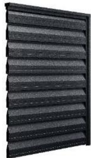
Secțiune panou gard pe profile de fixare stâlpi