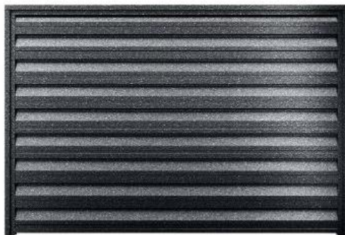
Panou gard pe profile de fixare stâlpi