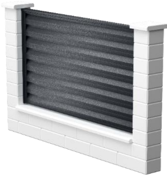
Panou gard cu bolțari